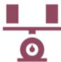
WEIGHING & FILLING