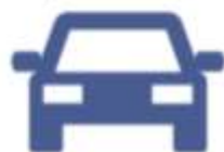
AUTOMATION & AUTOMOTIVE