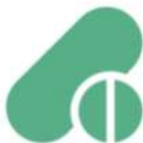
PHARMA & NUTRACEUTICALS