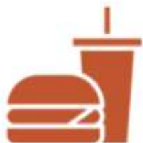
FOOD & BEVERAGE