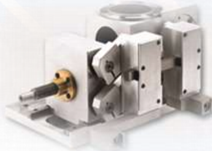
Unità Meccanica Assemblata