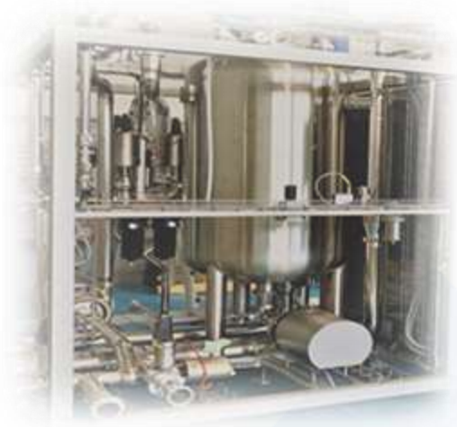
Impianto Skid di preparazione e dosaggio liquidi