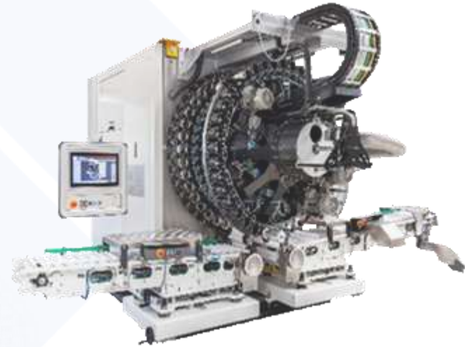
Macchinario per il metalpackaging